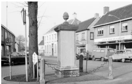
Café de Pomp (links) en Café Prins van Auvergne (Rechts)

Er werd op donderdag 14 februari 1974 vergaderd met burgemeester, politie, de Hoevense kasteleins en afgevaardigden van de landelijke Horeca-organisatie. Op deze vergadering heeft de burgemeester gezegd dat er een vergissing werd gemaakt en dat alle agitatie berustte op een levensgroot misverstand. Hij bood de kasteleins daarvoor zijn excuses aan. En daarmee is dan voor Hoeven deze zaak opgelost. Niet in de laatste plaats tot grote blijdschap van de kasteleins en waarschijnlijk ook voor alle peejen en peejinnen en bleef de tap tot 02.uur open.