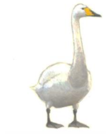
145-160 cm, spanwijdte 205-275

De wilde zwaan is één van de meest zeldzame broedvogels van Nederland. Sinds 2015 broedt de soort jaarlijks met 1-2 paren in Nederland. Wilde zwanen hebben een echte zwanenhals. Ze houden de nek vaak gebogen.